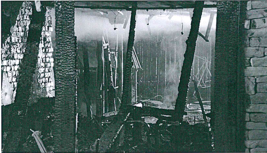
1. sz. kép: Szekszárd, Bródy köz 20.

Március 11-én Szedres, külterület, 15 hektáron nádas, sásos, bokros, fás terület égett, fokozat: II/K.